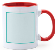
LINKS VOM GRIFF Sublimation Q (50mm x 85mm)