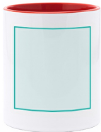
FRONT Sublimation Q (50mm x 85mm)