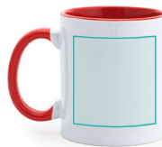
RECHTS VOM GRIFF Sublimation Q (50mm x 85mm)